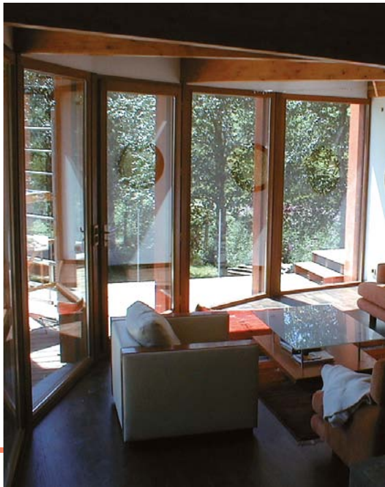
Architecte : Sandrine Tissot