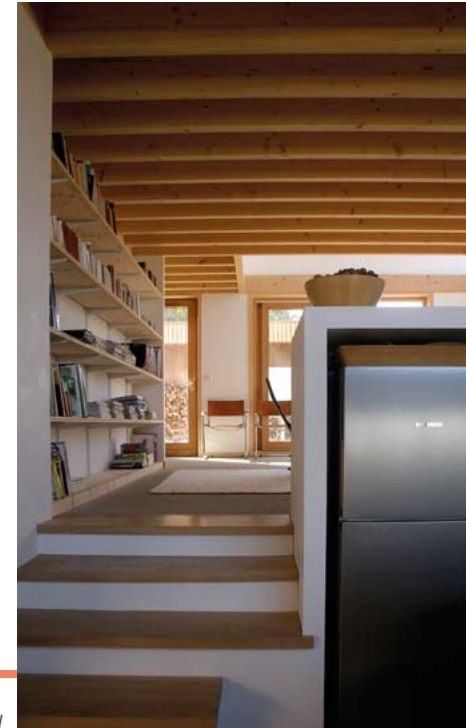
Architectes : Quirot-Vichard