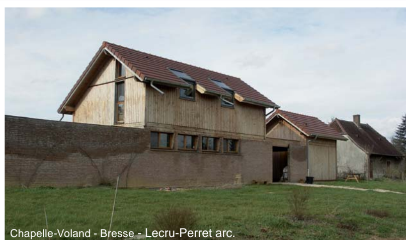
Chapelle-Voland - Bresse - Lecru-Perret arc.

Elle limite la parcelle et établit le dialogue direct avec le paysage et les passants.