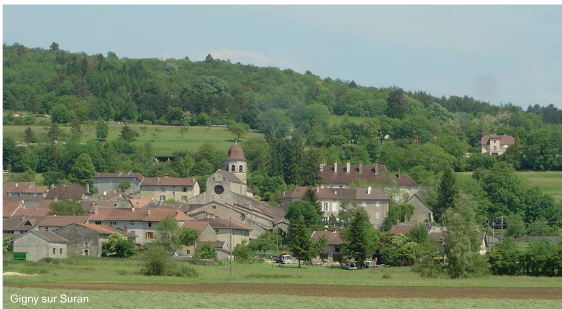
Gigny sur Suran

Une multiplicité de paysages implique une multiplicité de projets. Les éléments présents sur le site peuvent enrichir le projet.