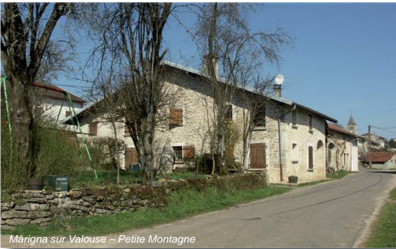
Maigna sur Valouse - Petite Montagne

La juxtaposition des bâtiments compose un ensemble linéaire organisé : la rue.