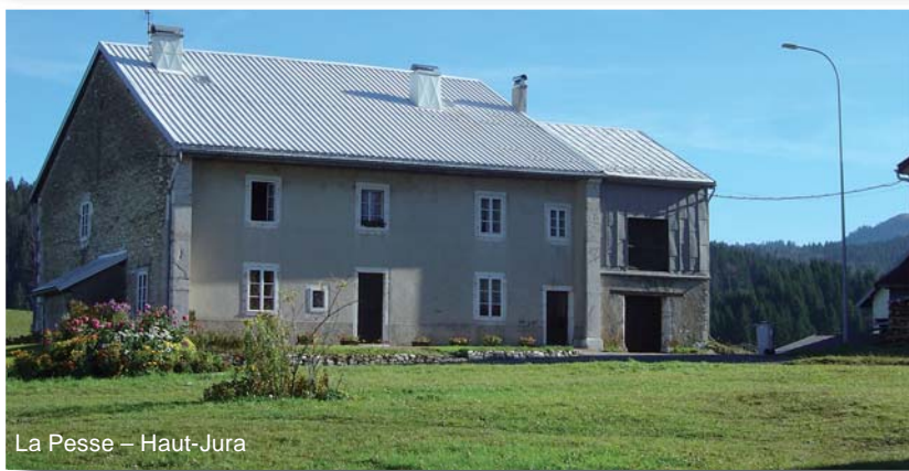
La Pesse - Haut-Jura

Comprendre que sa parcelle est un morceau de paysage partagé.