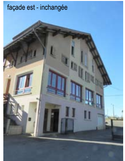
façade est - inchangée

Compte tenu de l'enduit beige rosé existant sur le volume est, et des châssis de fenêtre rouge «ral 8072», une couleur «beige rosé» est choisie dans la gamme STO n° 323169 – 76 – C1